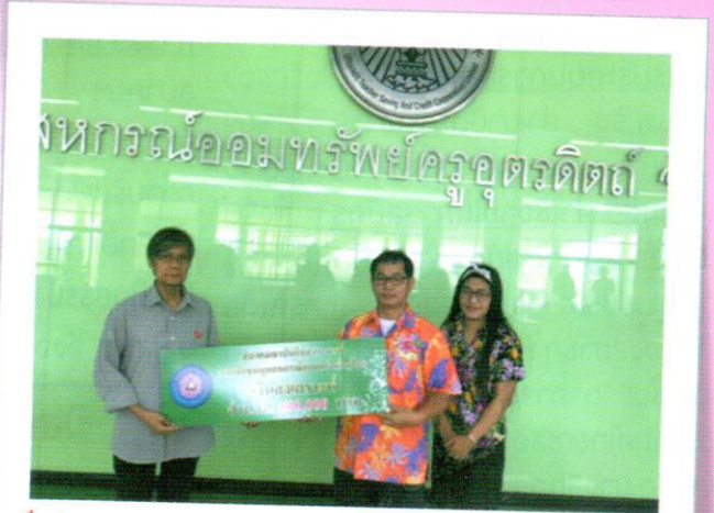
ศูนย์ประสานงานสหกรณ์ออมทรัพย์ครูอุดรดิตรต์