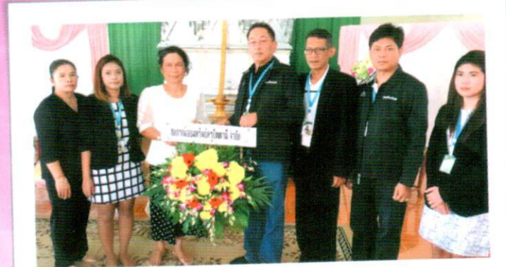
ศูนย์ประสานงานสหกรณ์ออมทรัพย์ครูปัตตานี

สสอ.เป็นองค์กรสวัสดิการมาปณกิจสงเคราะห์ในสหกรณ์ออมทรัพย์กลุ่มวิชาชีพครู กรณีที่ สหกรณ์ออมทรัพย์ต้นสังกัดสมาชิกเป็นศูนย์ประสานงาน เวลาจะสมัคร,ชำระเงินสงเคราะห์ฯ หรือรับทราบข้อมูลข่าวสารต่างๆของสมาคมสมาชิกก็เดินไปที่สหกรณ์ได้เลย ซึ่งขณะนี้สมาชิกอีกมากต้องการสมัคร สสอ.แต่สหกรณ์ต้นสังกัดยังไม่เป็นศูนย์ประสานงาน สสอ.ขอแจ้งให้ทราบว่าท่านสามารถติดต่อสมัครได้ที่ศูนย์ประสานงานในจังหวัดของท่าน จ.นครราชสีมา สมัครได้ที่ ศูนย์ประสานงาน สอ.สามัญศึกษาจังหวัดนครราชสีมา จ.อุดรธานี สมัครที่ ศูนย์ประสานงาน สอ.เสมาธรรมจักรอุดรธานี จ.อุบลราชธานี สมัครที่ศูนย์ประสานงานสหกรณ์ออมทรัพย์ข้าราชการกระทรวงศึกษาธิการอุบลราชธานี