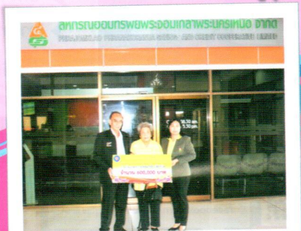
ศูนย์ประสานงานสหกรณ์ออมทรัพย์พระจอมเกล้าพระนครเหนือ