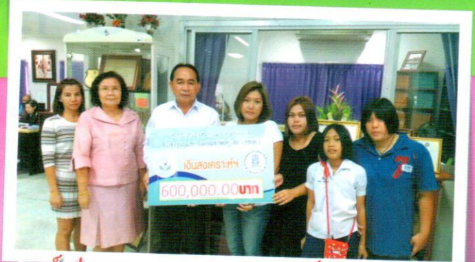
ศูนย์ประสานงานสหกรณ์ออมทรัพย์ข้าราชการสังกัดกระทรวงศึกษาธิการ จ.อุบลราชธานี